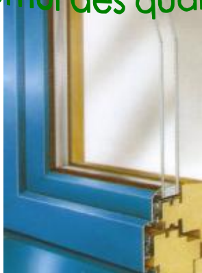
CHASSIS 56mm + ALU

En RECTO-VERSO, le cumul des qualités !!!